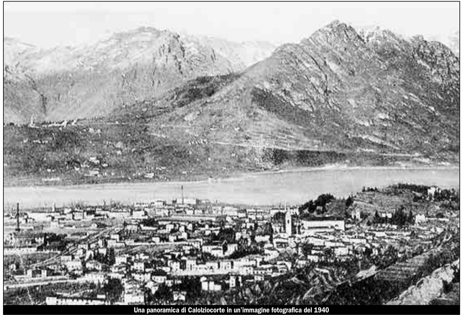
Una panoramica di Calolziocorte in un'immagine fotografica del 1940

■ Durante il ventennio fascista, e in particolare con la fitta serie di decreti governativi emanati nel 1927, si procedette in Italia alla soppressione di molte piccole circoscrizioni comunali e al loro conseguente accorpamento all'interno di nuove unità amministrative più ampie, popolose e territorialmente estese. Il caso di Calolziocorte, nelle vicinanze di Lecco, è al proposito emblematico: prima distinto nei comuni confinanti ma autonomi di Calolzio e di Corte, venne creato nel 1927 attraverso la loro unificazione e nel 1928 assunse le dimensioni attuali con la fusione al neonato Comune, di Lorentino e Rossino in precedenza unità amministrative a sé stanti. E proprio richiamandosi alla genesi di questa complessa identità amministrativa, il