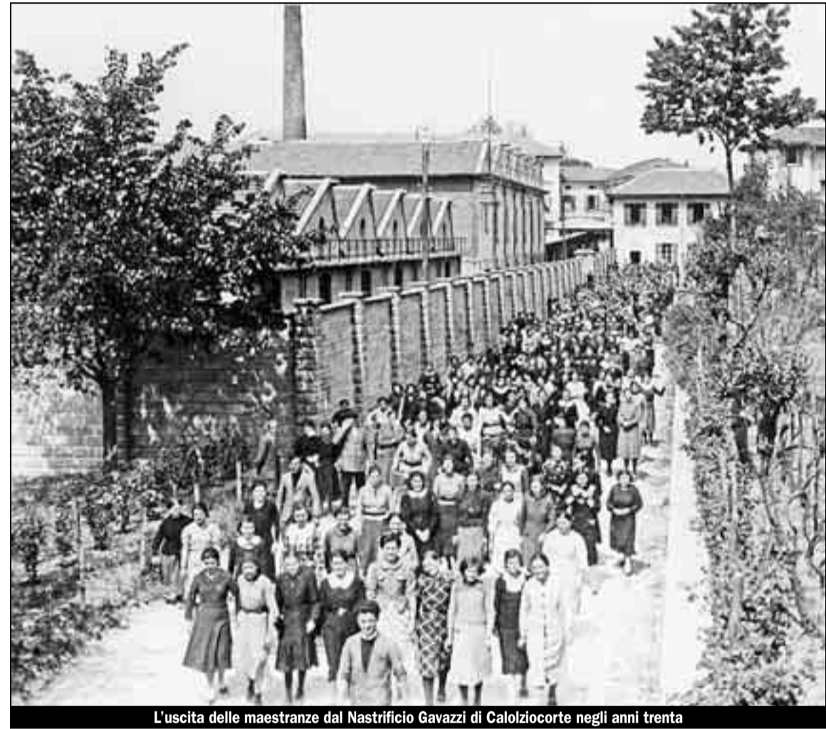
L'uscita delle maestranze dal Nastrificio Gavazzi di Calolziocorte negli anni trenta

Il primo atto fu l'accorpamento dei Comuni confinanti di Calolzio e di Corte, l'anno dopo fu la volta di Lorentino e Rossino. Storia raccontata da Fabio Bonaiti nel nuovo libro «Calolziocorte 1807-1951. L'identità di un borgo, il destino di una città»